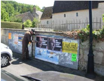
Le responsable de la propagande montre l'exemple !

Un grand bravo aux militants : encore une fois, le Front National était pratiquement seul sur le terrain face à la gauche et à l'extrême gauche !