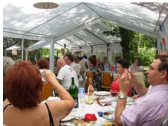
Fête champêtre du FN41

Nos 6 têtes de listes départementales ont été investies, les listes sont pratiquement bouclées, tout en demeurant ouvertes à des personnes qui pourraient nous rejoindre. Les premières réunions de campagne ont été un succès, les actions militantes se poursuivent tous les jours.