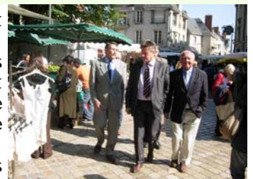
Marché Louis XII à Blois

Pour cela, nous allons mener une campagne de terrain, une campagne de tous les jours, dans les 6 départements de la région Centre, afin d'aller à la rencontre de nos compatriotes.