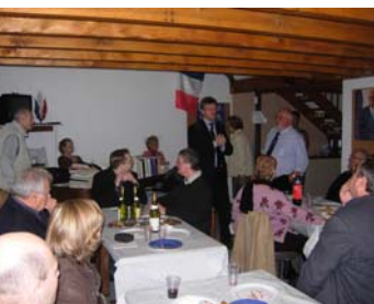
Réunion à Montargis

Tenez-vous informés de nos prochains rendez-vous auprès de vos fédérations, et sur le site de campagne www.loiseau2010.com