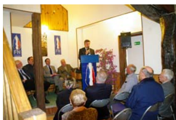
Réunion publique à Blois

de nos électeurs, cédant parfois au découragement, se sont encore abstenus aux européennes. Il est important de leur faire savoir que l'abstention ne sert que nos adversaires.