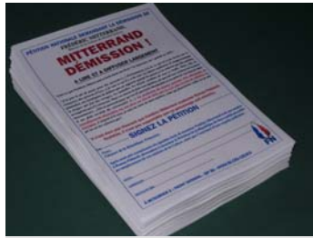
Une pétition diffusée à 8000 exemplaires en Loir et Cher