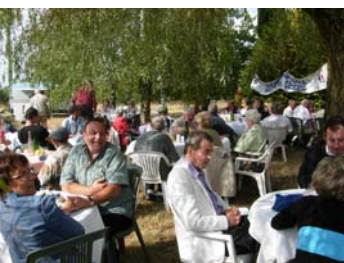
Fête champêtre du FN37

Front National a réussi cet automne son retour au premier plan de la scène politique.