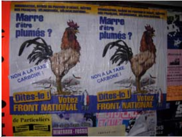
Le Front National affiche sa présence

Et ce n'est qu'un avant-goût de la campagne, dont la phase active va débiter après les fêtes.